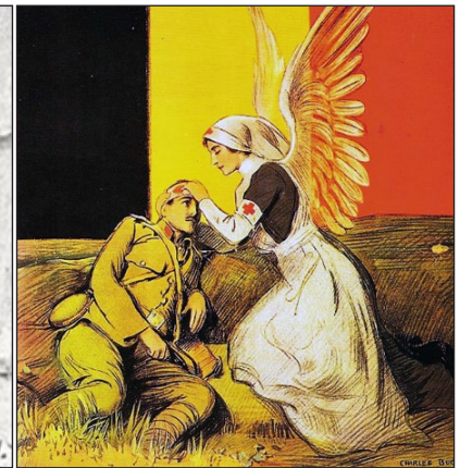
Fig. 8 en 9: De verpleegster als hoer en heilige.

Bron: Magnus Hirschfeld, Sittengeschichte , deel I, 137; Moeyes, Zwaardjaren , 258. Tekening: Charles Buchel.