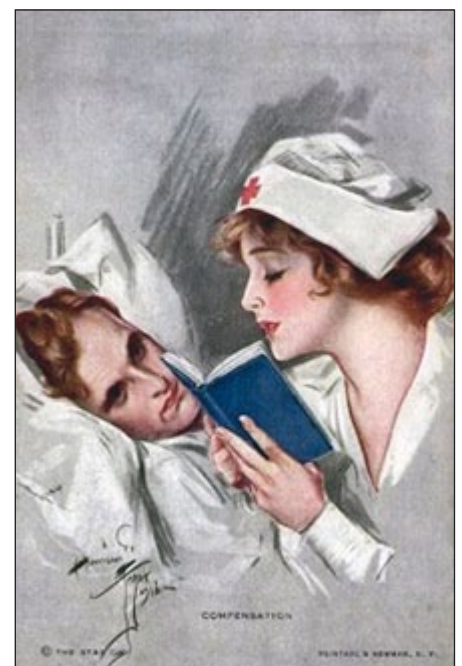
Fig. 2: De verpleegster als moeder.

Er was dan ook een nadeel verbonden aan dat beeld van natuurlijke, zachte lieflijkheid, dat beeld van moederlijke toewijding. De aanwezigheid van dergelijke verpleegsters zou mannen er weleens toe kunnen brengen langer in het hospitaal te willen blijven dan militair gewenst. Het zou weleens ten koste van het oorlogsenthouziasme kunnen gaan. Dus werden verpleegsters bij zo'n beetje alle oorlogvoerende landen zoveel als mogelijk weggehouden van de fronthospitaal, wat bijvoorbeeld zeer tegen het zere been was van suffragette Mabel St. Clair Stobart, die in de Balkanoorlog van 1912-1913 het Women's Sick and Wounded Convoy Corps had opgericht, en in de Eerste Wereldoorlog werkte bij de St. John's Ambulance Association . Zij had grote bezwaren tegen deze opvatting, omdat volgens haar alleen vrouwen voor de juiste, prettige sfeer konden zorgen die voor spoedig herstel zo bitter noodzakelijk was, waardoor de mannen weer naar het front konden terugkeren. Vrouwelijkheid kon volgens haar zeer wel worden ingezet ter ondersteuning van het militaire bedrijf en was allesbehalve een verzwakking daarvan 10 .