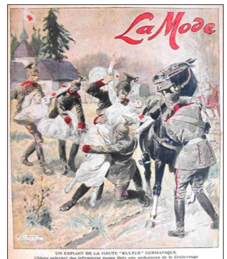
Fig. 7: De rol van de verpleegster in de gruwelpropaganda.

Dat de gewonden verwachtten dat de verpleegsters zouden handelen overeenkomstig het hen voorgehouden beeld en overeenkomstig de rolverdeling die zij van huis uit kenden en dat de reacties op verpleegsters die bij hun handelingen pijn veroorzaakten en/of vanuit hun positie de gewonden bevelen gaven, niet altijd even verijnd waren, leidde al met al tot het intens contradictoire beeld over de verpleegster als engel en dominatrix in één. In theorie werden zij voorgesteld als les anges blancs , als witte engelen, bezongen in succesvolle liederen als The rose of no man's land ?