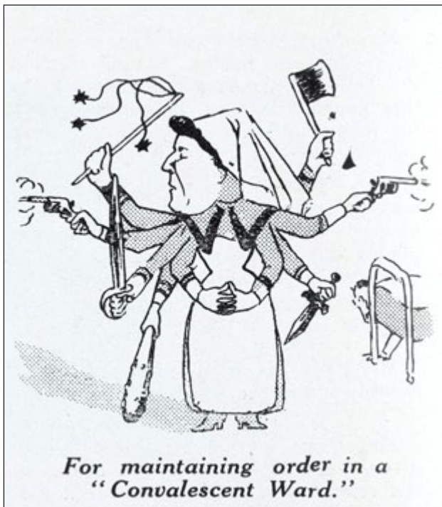
Fig. 6: De verpleegster als pijnbrenger.

Bron: Carden-Coyne, Politics of Wounds , 294 (RAMC Muniment Collection Wellcome Library, Londen).