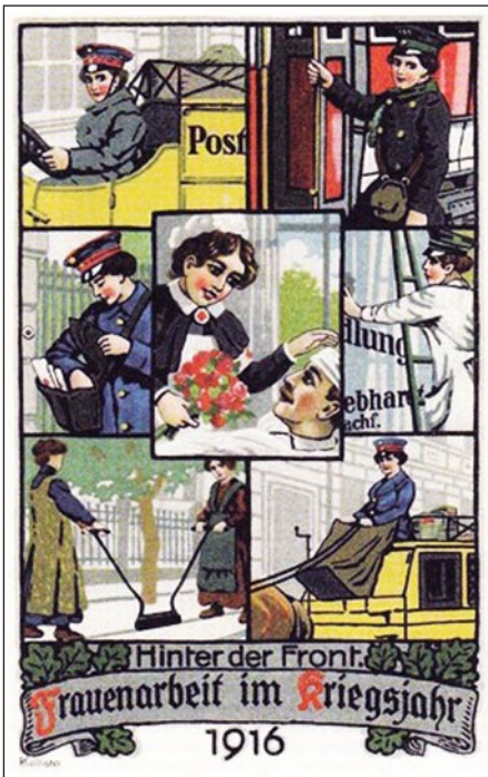
Fig. 1: De rol van de vrouw in de propaganda.